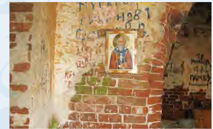
Придел Сергия Радонежского. Май 2012 года

нашей надежды и опоры, нашего будущего), парализовать их веру. Катоки 70 летнего «советского Вавилонского плена» (воинствующего атеизма) тяжело прошелся по народу. За Богоотступничество в 20 веке Россия заплатила 60 миллионами человеческих жизней, а по некоторым оценкам и до 100 млн.