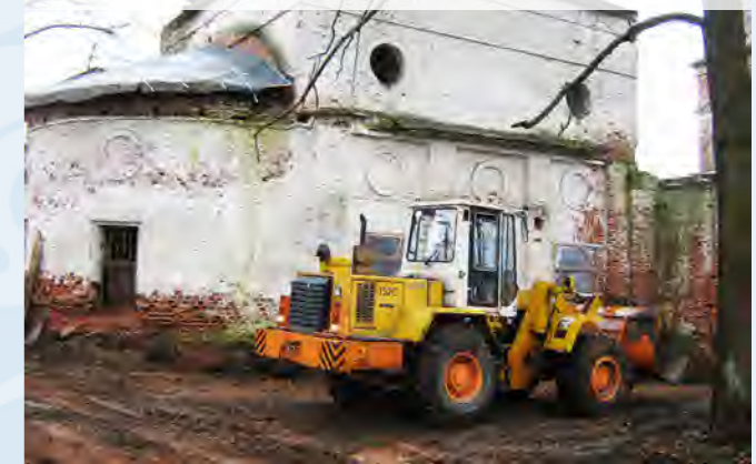
Расчистка территории с северной стороны храма (Придел Сергия Радонежского). Октябрь 2012 года.

13. Всем миром нужно восстанавливать разрушенные храмы, жертвуйте на восстановле-