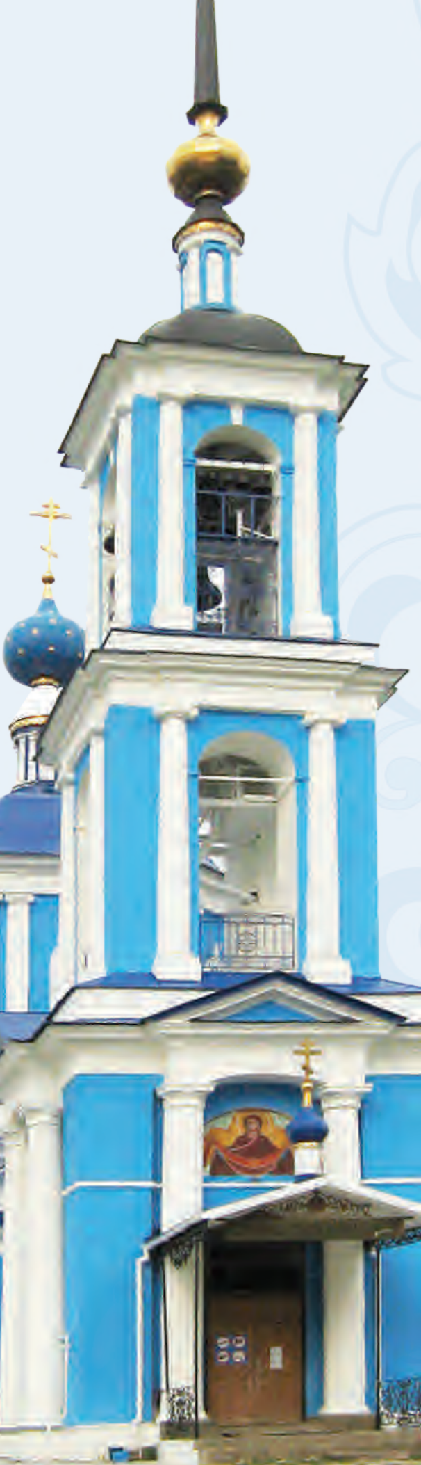
Храм в честь иконы Иерусалимской Божией матери в п. Старый Городок Тверской области