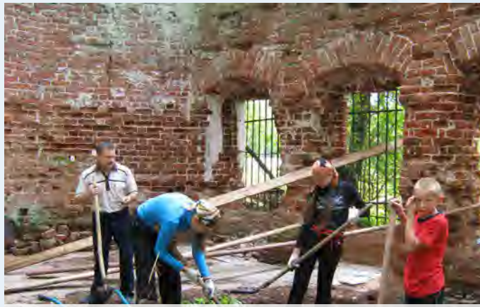
Расчистка территории трапезной храма (Придел Андрея Первозванного.) Август 2012 года.