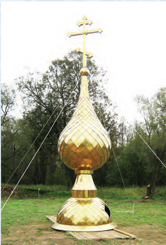
Ищем жертвователей на купол, кирпич, железо.

ние храмов, требуйте от властей всех уровней планировать в своих бюджетах на это средства. Храмы были разрушены, закрыты, осквернены в советское время, на многих и до настоящего времени царит мерзость запустения. А так как Россия является правопреемницей СССР, то нужно отвечать всем нам по обязательствам и долгам, иначе и за нас некому будет ответить в будущем. Только с Верой мы можем защитить независимость Родины.