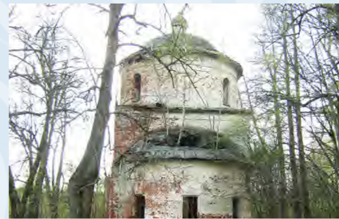
Храм после 80-летнего осквернения. Май 2012 года.

Да в том, что мы с БОГОМ и многие познают и приходят к Нему, а они нет. Церковь стоит, идет живая молитва к Богу, и врата ада ее не одолеют. Познание Бога, воцерковление русского народа к сожалению идет недостаточно быстро. Враг не дремлет, и старается завладеть умами людей (особенно молодого поколения,