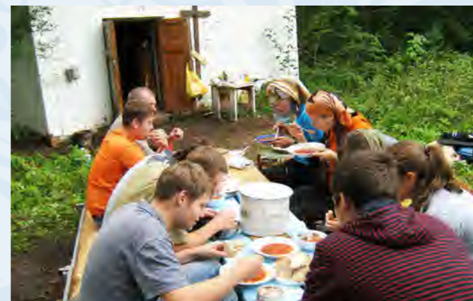
Московские и Киржачские ребята объединились.

5. Каждое утро читайте утренние молитвы, благодари Бога за прошедшую ночь, за то что, по неизреченной своей милости, не погубил нас за наши беззакония. Без молитвы не начинайте ни какого дела. Утром молитвы не исполнил – день пропал.